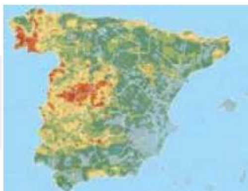
Figura 2. Mapa de presencia de radón en los suelos de España

El radón se libera del suelo a la atmósfera, y también al aire de interiores como consecuencia del flujo de gases del suelo subyacente a los cimientos de los edificios.