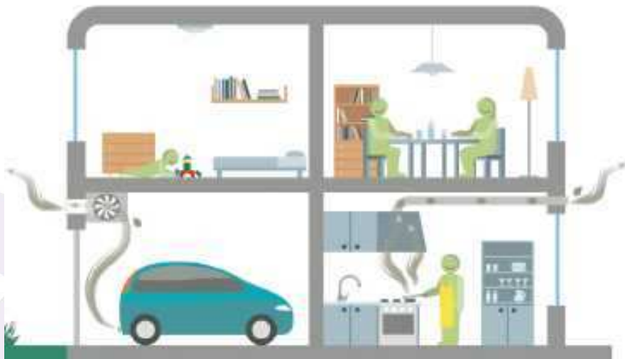
Figura 1. Ventilación de los distintos espacios interiores de un edificio

del exterior. El principal contaminante interior que originaba productos derivados de la combustión era el humo del tabaco. Con la entrada en vigor de la ley frente al tabaquismo, se establece la prohibición de fumar en múltiples locales y en los lugares de trabajo, por lo que se está consiguiendo una disminución notable de los contaminantes originados por el tabaco. Las calderas, las cocinas y los vehículos a motor también originan este tipo de compuestos, por lo que es recomendable que la ventilación de estas instalaciones se encuentre separada del resto del edificio (ver figura 1 ).