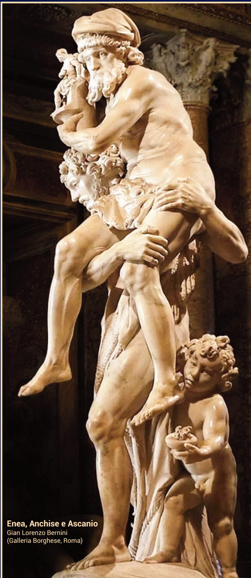
Enea, Anchise e Ascanio Gian Lorenzo Bernini (Galleria Borghese, Roma)