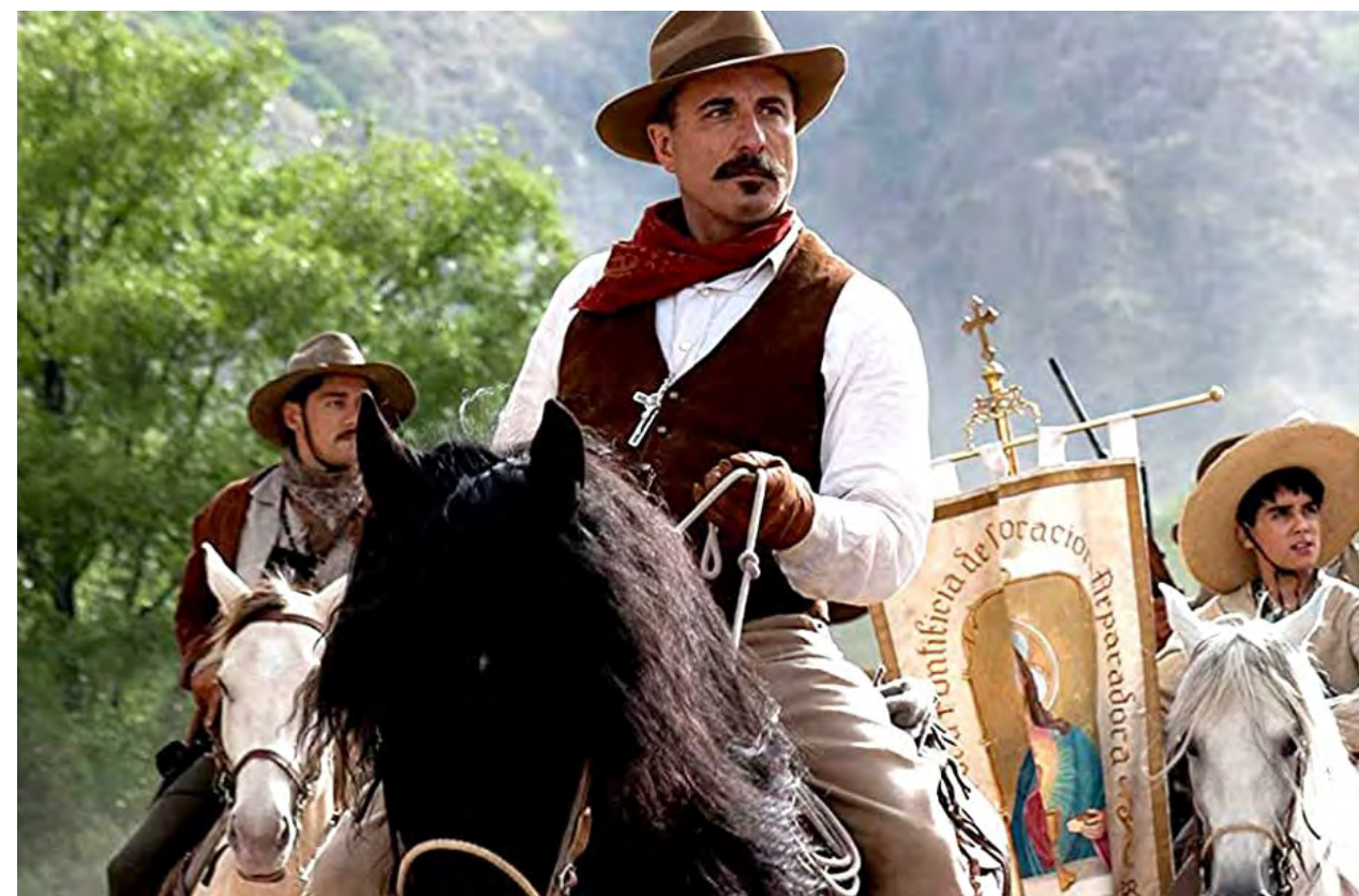
Claudia Talancón, Rubén Blades, entre otros.