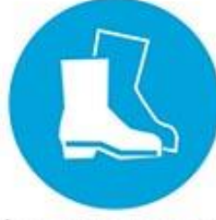
İş ayakkabısı giy