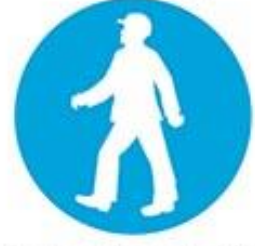
Yaya yolunu kullan