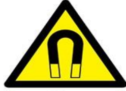
Kuvvetli manyetik alan