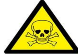
Toksik (Zehirli) madde