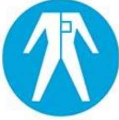
Koruyucu elbise giy