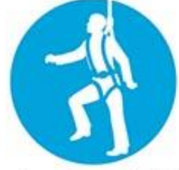
Emniyet kemeri kullan