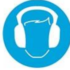
Kulak koruyucu tak