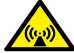
İyonlaştırıcı olmayan radyasyon