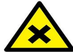
Zararlı veya tahriş edici madde