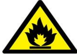
Parlayıcı madde veya yüksek ısı