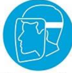
Yüz siperi kullan