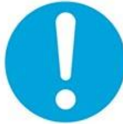
Genel emredici işaret (gerektiğinde başka işaretle birlikte kullanılacaktır)