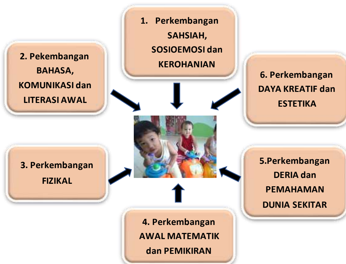
Rajah 1.2 Enam Ciri-Ciri yang Ingin Diperkembangkan Dalam Kalangan

Adalah menjadi hasrat sesuatu kurikulum untuk menghasil sesuatu dalam kalangan pelajar Kurikulum PERMATA direka bentuk untuk memperkembangkan ENAM aspek kanak-kanak berumur 0 hingga 4 tahun. Lihat Rajah 1.2 yang menunjukkan hasil pembelajaran yang ingin dicapai setelah mengikuti Kurikulum PERMATA.