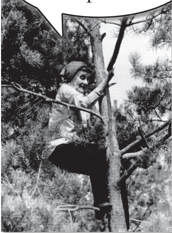
3 pav. Medyje Astrida Lindgren

Vienas svarbiausių švedų vaikų literatūros objektų Stokholme – muziejus „Junibakenas“, unikalus Lindgren knygų pasaulis. Įdomiausia šio 1996 m. įkurto muziejaus atrakcija – kelionė pasakų traukiniu, apsilankant pas įvairiausius Lindgren knygų herojus. Greta „Junibakeno“ stovi Lindgren paminklas.