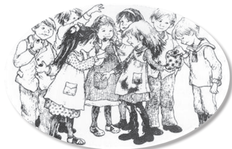
2 pav. Iliustracija iš knygos „Pepė Ilgakojinė“

Mokslus krimto lengvai , bet kalikė nebuvo. Jos rašinius mokytojai gyrė. Skaitė balsu visai klasei... Net praminė Astridą Selma Lagerlof – tuo metu ši rašytoja Švedijoje buvo bene geriausia. Astridai tai nepatiko.