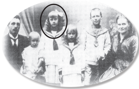
1 pav. Astrida – antras vaikas iš kairės